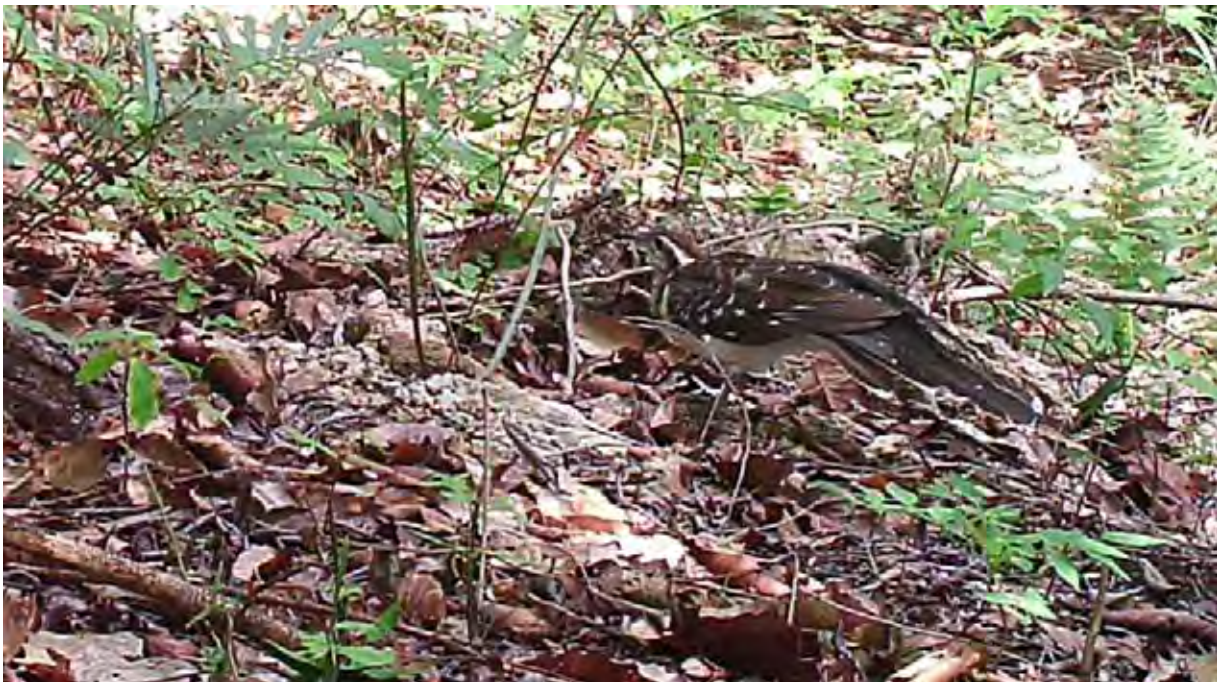
Figura 4. Cuco Faisán ( Dromococcyx phasianellus ) mediante fototrampeo.

Esta ave, únicamente se conoce para la zona oriental de El Salvador, ha sido registrada, la mayoría de veces, por su canto o llamada. Es la primera vez que se documenta con una fotografía obtenida con la técnica del fototrampeo, de fecha 11 de noviembre de 2018 (Figura 4).