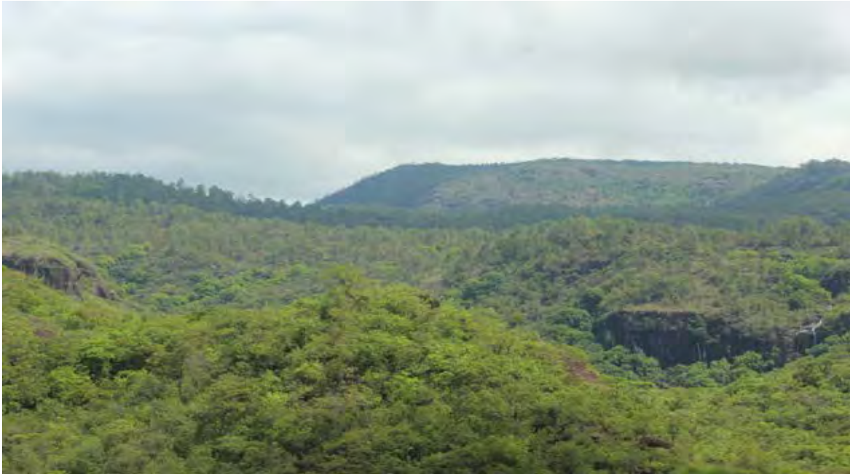
Figura 2. Cobertura arbórea de la zona alta de la cuenca.