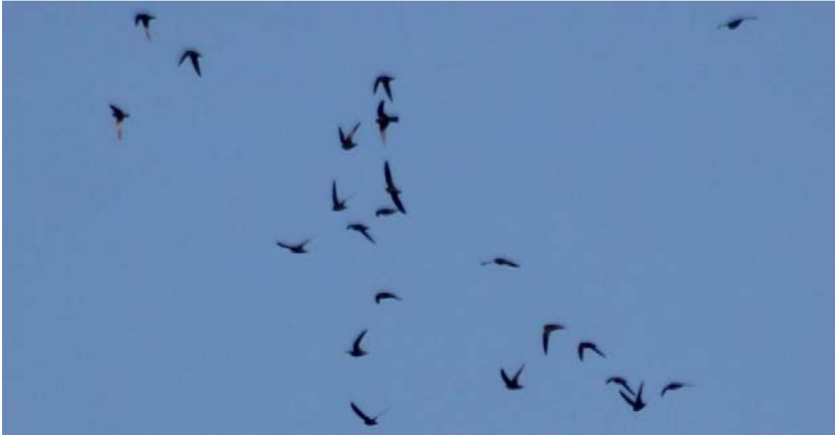
Figura 5. Vencejo Negro ( Cypseloides niger ).

la mayoría de veces ha sido observada en zonas altas, pero también en ciudades y en la zona costera (eBird, 2019). Este es el primer registro para el departamento de Morazán (Figura 5).