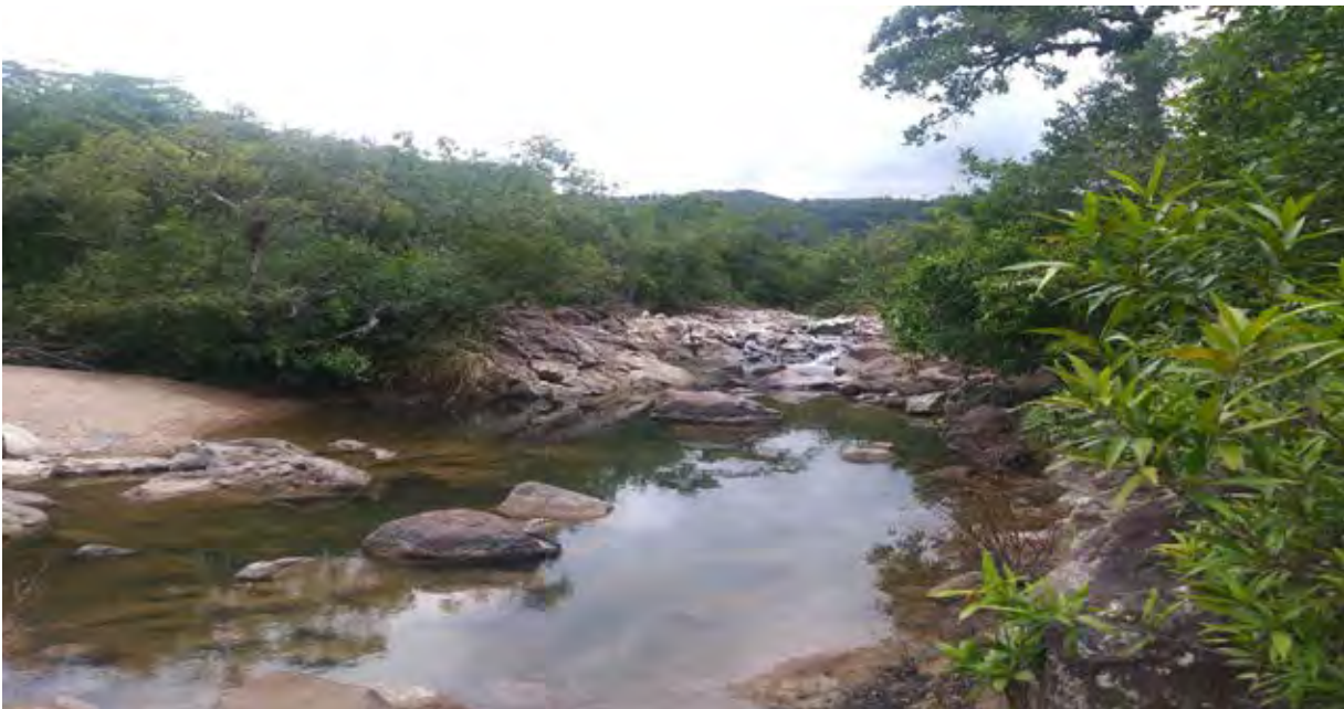
Figura 3. Panorámica del río y su cobertura arbórea.

y no publicados de aves de El Salvador, desde 1884 hasta 2009 para un total de 540 especies, la cual puede ser consultada en las oficinas de dicha organización.